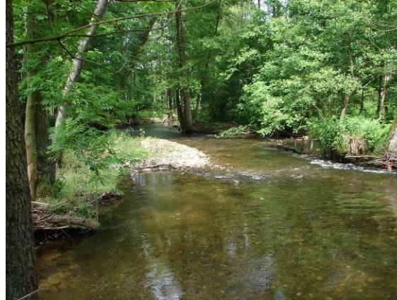
Der Weiße Main ist die Lebensader des FFH-Gebiets

Das NATURA 2000-Gebiet ist aufgrund seiner außergewöhnlich reichen Tier- und Pflanzenwelt von landesweiter Bedeutung. Geprägt vom Weißen Main und dank einer angepassten Bewirtschaftung konnte sich hier eine naturnahe Auenlandschaft entwickeln, die in Oberfranken ihresgleichen sucht.