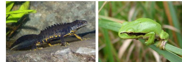
In den fischfreien Stillgewässern in der Blumenau kommen diese stark gefährdeten Lurche noch vor: Kammolch (li.) und Laubfrosch (re.)

Sehr günstig für den Artenreichtum ist die extensive Bewirtschaftung der Aue durch Schafbeweidung und Heumahd. Zahlreiche, teils als Ausgleichsmaßnahmen hergestellte Stillgewässer wie Tümpel und Altwasser sind ein wahrer Magnet für Libellen und Amphibien, darunter auch Raritäten wie die FFH-Arten Kammolch und Laubfrosch .