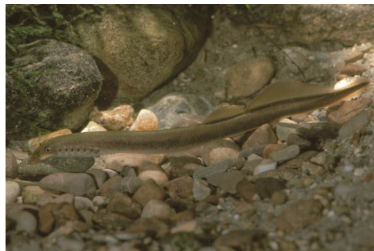
Das FFH-Gebiet zählt zu den besten Vorkommensgebieten von Bachneunaugen in Oberfranken

Der Weiße Main zeichnet sich durch große Naturnähe mit guter Wasserqualität und hoher Strukturvielfalt aus. Im Gewässer leben u.a. die FFH-Arten Bachneunauge und Mühlkoppe . Auch Prachtlibellen und Eisvogel sind hier regelmäßig zu beobachten. Erfreulich strukturreiche Auwälder mit Weiden, Erlen und Eschen begleiten den Weißen Main auf seiner gesamten Länge im FFH-Gebiet.