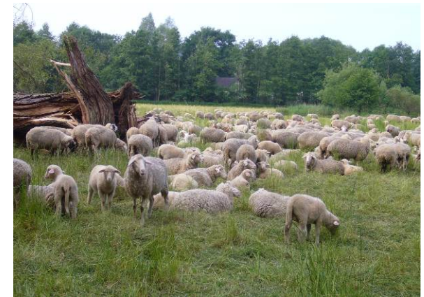
Die Beweidung mit Schafen erhält den Strukturreichtum der Biotopflächen

Sehr günstig für den Artenreichtum ist die extensive Bewirtschaftung der Aue durch Schafbeweidung und Heumahd. Zahlreiche, teils als Ausgleichsmaßnahmen hergestellte Stillgewässer wie Tümpel und Altwasser sind ein wahrer Magnet für Libellen und Amphibien, darunter auch Raritäten wie die FFH-Arten Kammolch und Laubfrosch .